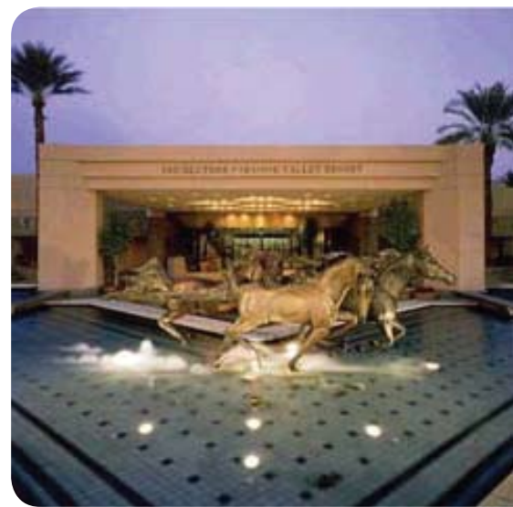
Paradise Valley Resort, Scottsdale, AZ

will get a lot out of the time you spend there. But space is very limited—you are encouraged to register today as we expect it to fill up quickly and sell out. As you can see from the program overview