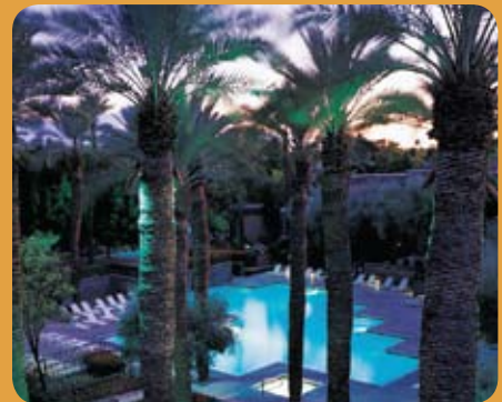
One of the pools