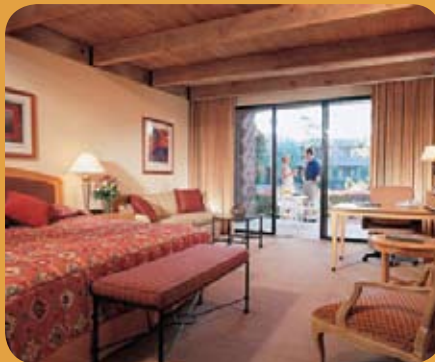
Doubletree Paradise Valley Resort